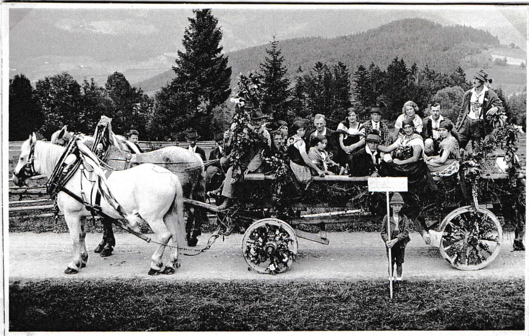
Der Festwagen „Jung Kreuzberg“; die Pferde, könnten die vom Grachler sein – der hatte einen Schimmel, auf der „Voslhöh“