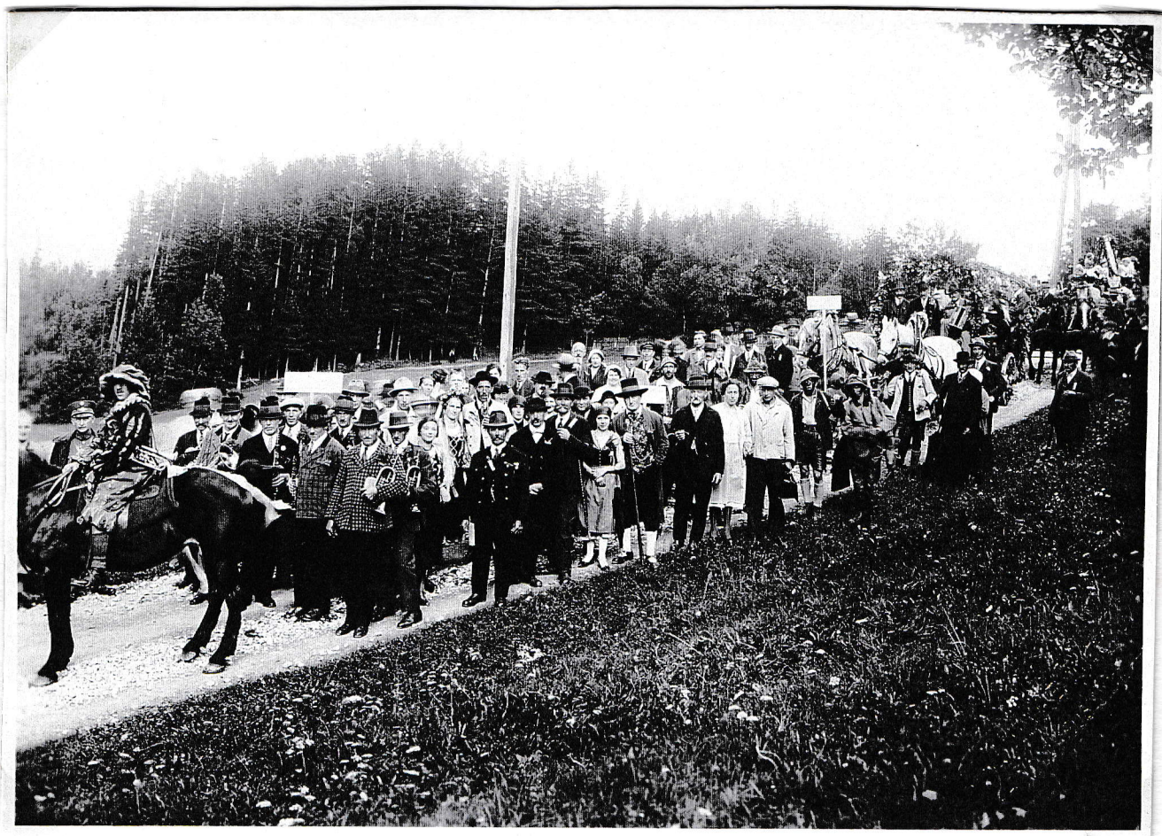
Gesamte Gruppe: Herold, Musik, Festgäste, Bewohner u. d. Festwagen